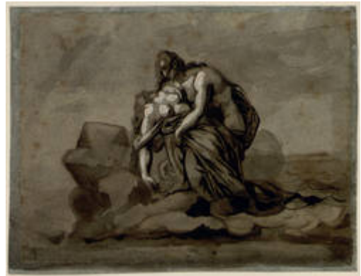
Théodore Géricault, "Jeune homme tenant dans ses bras une femme qu'il vient de retirer des flots : Paul et Virginie (?)", vers 1816

Puisant son inspiration dans les œuvres des maîtres exposés, et notamment dans leurs paysages, la proposition de l'artiste reliera ainsi étroitement dessins anciens et contemporains. Son axe de recherche vise l'expérience totale, artistique et physique, philosophique et spirituelle. Intégrée au sein même de l'exposition « La Fabrique de l'œuvre », l'expérience d'Eric Winarto s'accomplira au