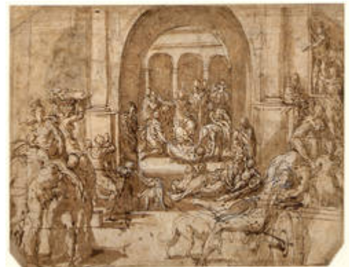
Girolamo Francesco Maria Mazzola dit Le Parmesan, "la guérison des malades", vers 1524-1527