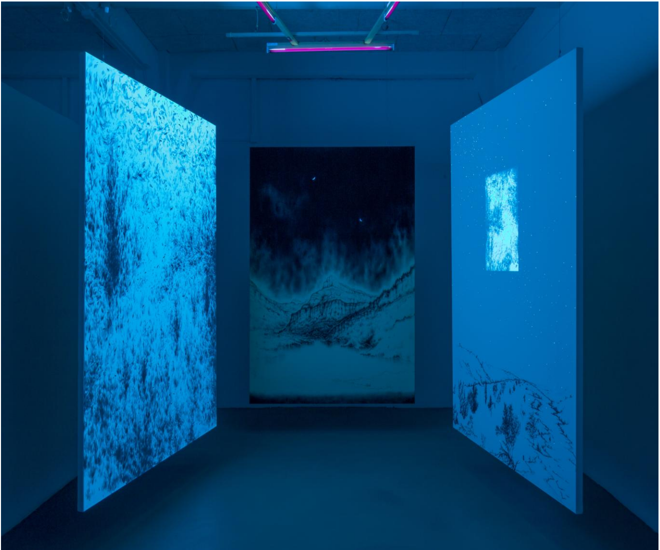
Éric Winarto exposition personnelle, mars 2015 Galerie FORMA, Lausanne, Suisse

Sous lumière noire, les mêmes œuvres se dévoilent.